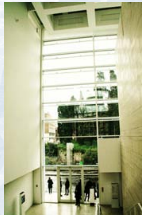
Ara Pacis, veduta dall'interno