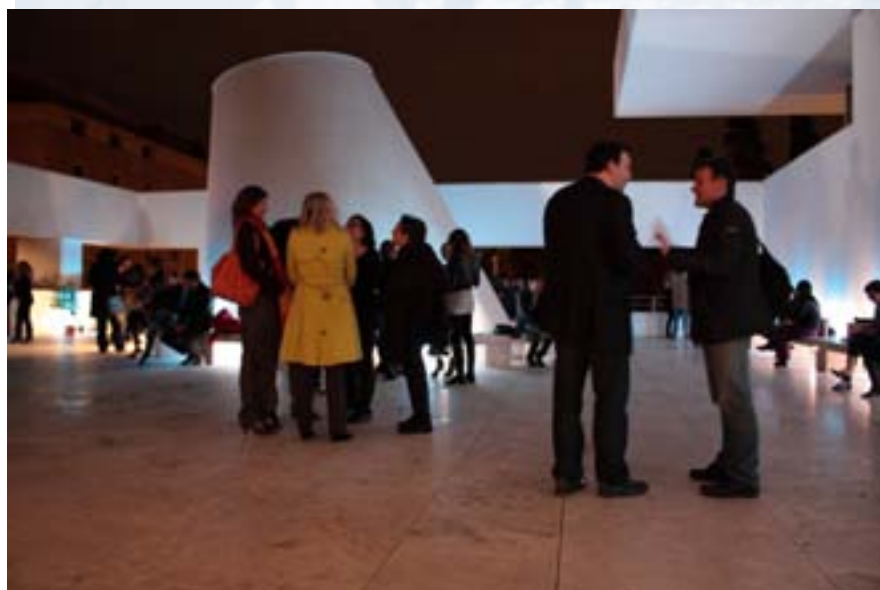
The Next Stop_ foto festa finale