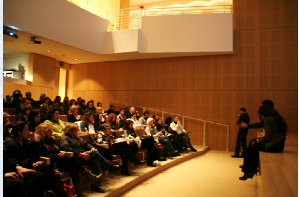
The Next Stop_ foto lezioni