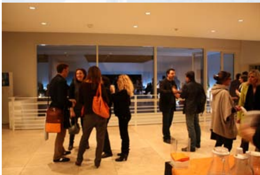
The Next Stop_ foto lezioni